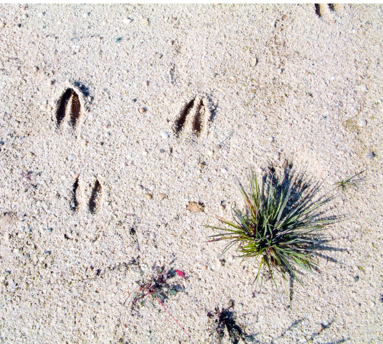
Durch die Renaturierung nach der Sandgewinnung entstehen landschaftsschutztechnisch attraktive Flächen.

Über den gesamten Lebenszyklus eines Gebäudes hinweg ist Kalksandstein ein nachhaltiges Bauprodukt: ökologisch verantwortungsvoll, ökonomisch lohnenswert, soziokulturell wertvoll. Die KS* Bauweise trägt somit im hohen Maß zur nachhaltigen Optimierung eines Bauwerks bei – und ist im Falle eines Rückbaus zu 100% recyclebar.